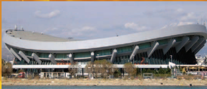
ΣΤΑΔΙΟ ΕΙΡΗΝΗΣ & ΦΙΛΙΑΣ