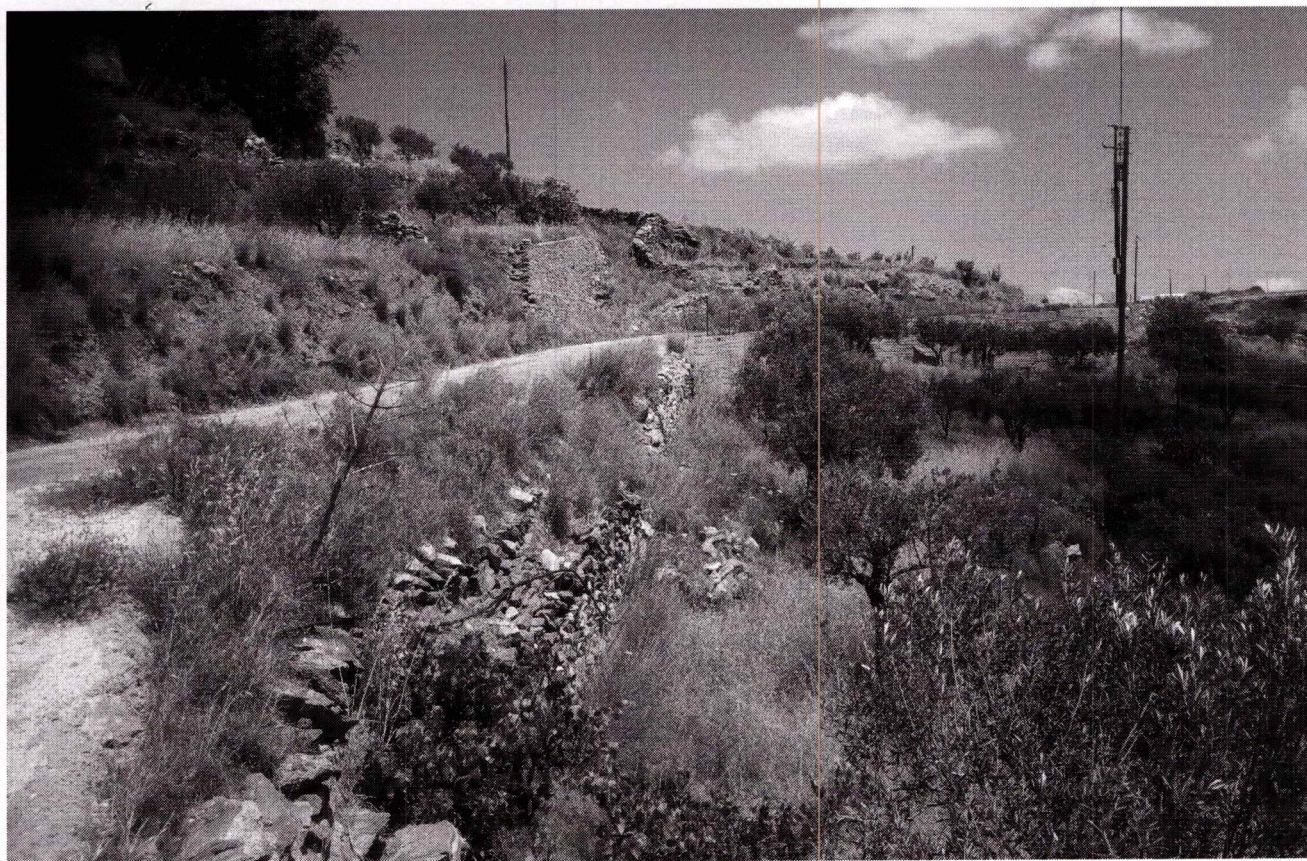
Φωτογραφία 1: Τοίχος αντιστήριξης στο περιφερειακό Κώστου προς Υστέρνη