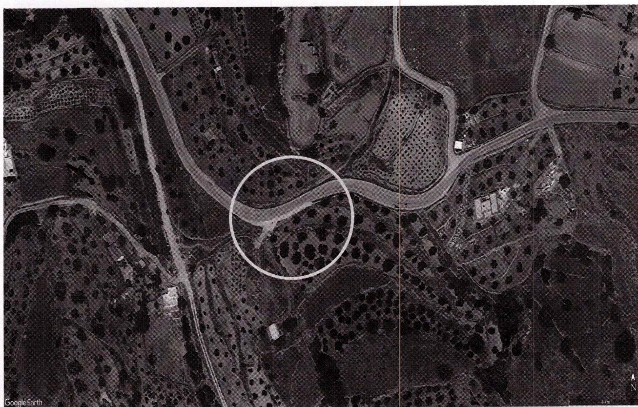
Φωτογραφία 2: Αεροφωτογραφία της θέσης του Τοίχου αντιστήριξης στο περιφερειακό Κώστου προς Υστέρνη