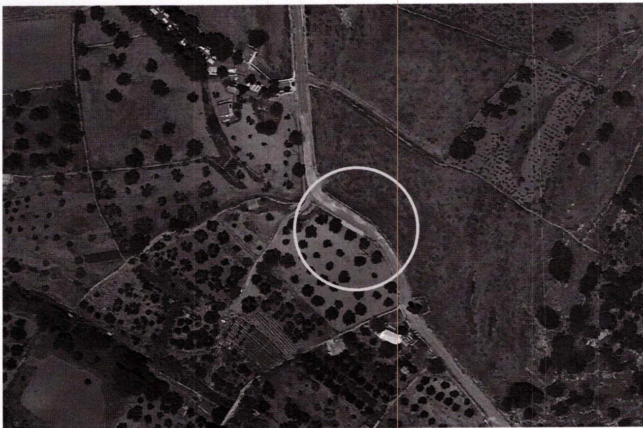
Φωτογραφία 6: Αεροφωτογραφία της θέσης του Τοίχου αντιστήριξης στον οικισμό Κώστου (πλησίον Κοιμητηρίου)